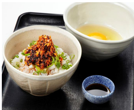
「にんにくラー油の TKG」イメージ