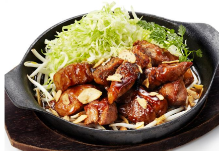
「トンテキガーリック」イメージ